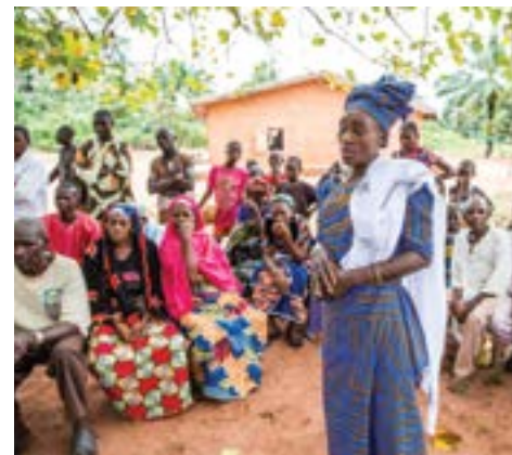
Ajenejo village meeting on the need for NTD prevention / Η κοινότητα στο Ajenejo μιλά για την πρόληψη

Neglected tropical diseases (NTDs) are a group of infections affecting more than a billion of the world's poorest people. Though theoretically preventable with simple oral treatments taken once or twice a year, NTDs – most prevalent in remote rural areas, urban slums and conflict zones – continue to cause excruciating pain, disfigurement and chronic disability. In Kogi state, situated in the centre of Nigeria (the country with the highest number of people living with NTDs in Africa), Sightsavers is working to address four prevalent and devastating NTDs: river blindness, lymphatic filariasis, schistosomiasis and soil-transmitted helminthiasis. Through an extensive network of volunteer community drug distributors, the organisation aims to stop the spread of infection by ensuring everyone receives treatment, building healthy communities within Kogi state, where children no longer struggle with the health risks faced by their parents and grandparents.