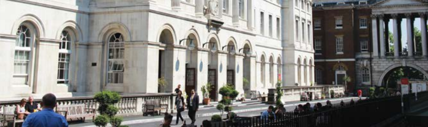
King's College London, Strand Campus / Άνοιξη του King's College στο Strand