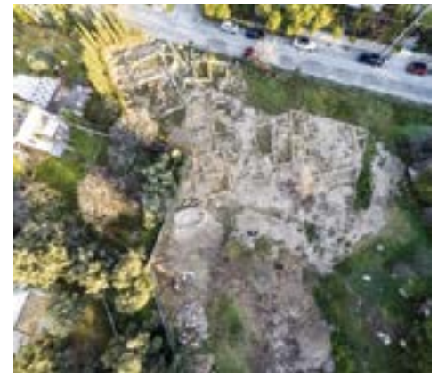
Aerial photograph of the site / Γενική άποψη της ανασκαφής

The systematic excavation at the site of Agios Nikolaos Pallon in the area of Voula in Attica, run by archaeologists of the Greek Ministry of Culture and Sports and independent researchers, testifies to continuous activity in this area, from the Classical period up to the Byzantine times. Excavations to date have unearthed part of a burial enclosure dating from the Classical period, houses and kilns dating from late antiquity and the remains of two Byzantine churches. One of the project's main objectives is the theoretical and practical training of archaeology students from universities in Greece and abroad, who participate in the excavation as volunteers. Support by the A. G. Leventis Foundation offered researchers the opportunity to go beyond the excavation to the compilation and implementation of scientific studies for the conservation and presentation of the ancient remains, working towards the ultimate goal of creating an archaeological park where visitors will learn about local history.