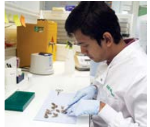
Grey partridge feathers dissected in WildGenes (DNA extraction) / Απομονώνοντας DNA στο εργαστήριο της WildGenes

The Royal Zoological Society of Scotland WildGenes laboratory, based at Edinburgh Zoo, specialises in using cutting-edge genetic analysis to achieve conservation action. Projects focus on in-situ monitoring, ex-situ management, reintroduction management and control of illegal wildlife trade. The RZSS WildGenes laboratory works alongside government agencies, conservation charities and zoos across the world to deliver data, advice and training through the provision of support and capacity building. With the support of the A. G. Leventis Foundation, and in collaboration with the Aristotle University of Thessaloniki in Greece and the Game and Wildlife Conservation Trust (GWCT), the WildGenes lab is using genetic analysis to inform management of grey partridge ( Perdix perdix ) populations in Scotland and Greece. The grey partridge is an IUCN Red List species due to its fragmented and diminishing populations, and collaborative efforts are being made to apply pioneering genomic techniques to generate high resolution data for this declining species.