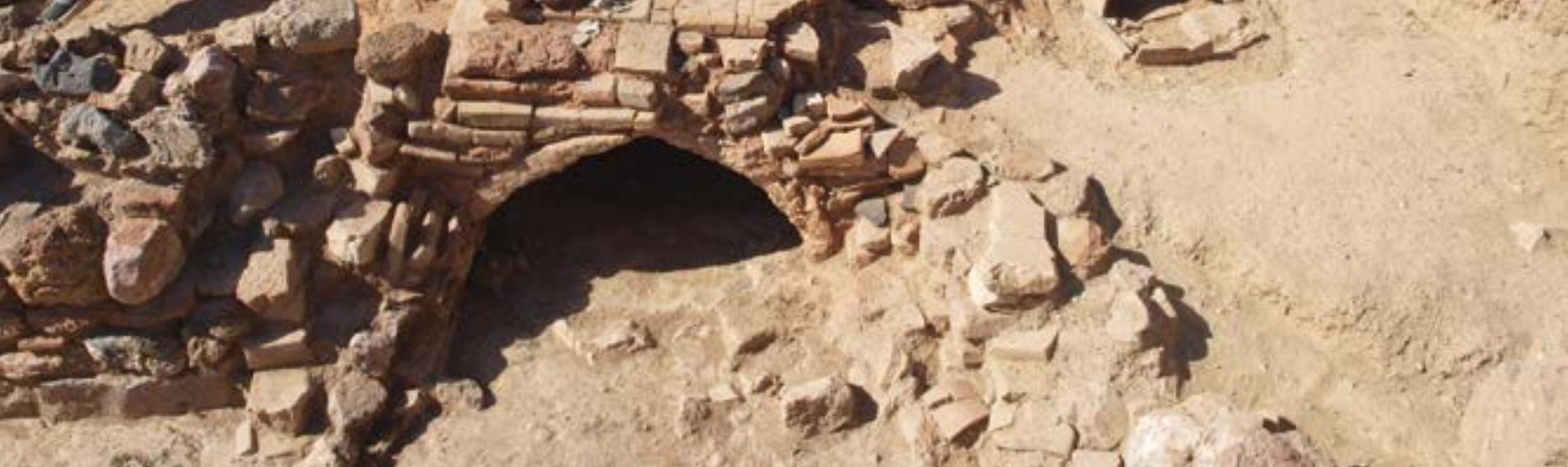
Roman kilns, Agios Nikolaos Pallon / Ρωμαϊκοί κλιβανοί, Άγιος Νικόλαος Πάλλων