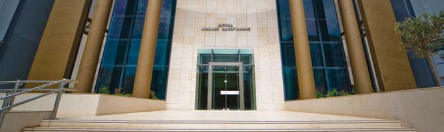
The Michael Cacoyannis Foundation in Athens / Το Ίδρυμα Μιχάλης Κακογιάννης, Αθήνα