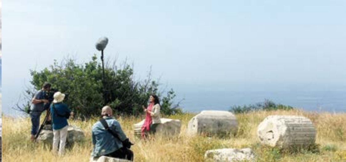
(left / αριστερά) Filming The Story of Aphrodite at Amathus / Από τα γυρίσματα στην Αμαθούιντα (right / δεξιά) Film crew on location / Στιγμιότυπο κατά τη διάρκεια των γυρισμάτων