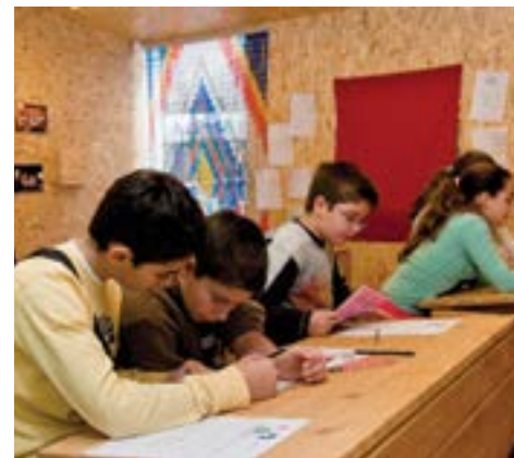
Engaging with others, in ActionAid's educational centre / Συμμετέχοντας, στο εκπαιδευτικό κέντρο της ActionAid

Building on its international experience in eradicating poverty and social exclusion around the world, ActionAid Hellas initiated a social support programme in 2016 targeting municipalities in Attica most affected by the crisis. Implemented through the creation of community centres offering a broad range of services, the programme empowers the most vulnerable groups within local communities so that they may break the vicious circle of poverty and marginalisation, with both immediate and long-term results. The first community centre, Epikentro , in the municipality of Athens, provides services for children, adolescents and adults in need: innovative empowerment programmes involving instruction in new skills; psychosocial support; legal, accounting and financial counselling and support services; and job centre and counselling services for the unemployed. The programme's methodology draws on ActionAid's human rights-based approach and is implemented in partnership with leading local NGOs and experienced professionals.