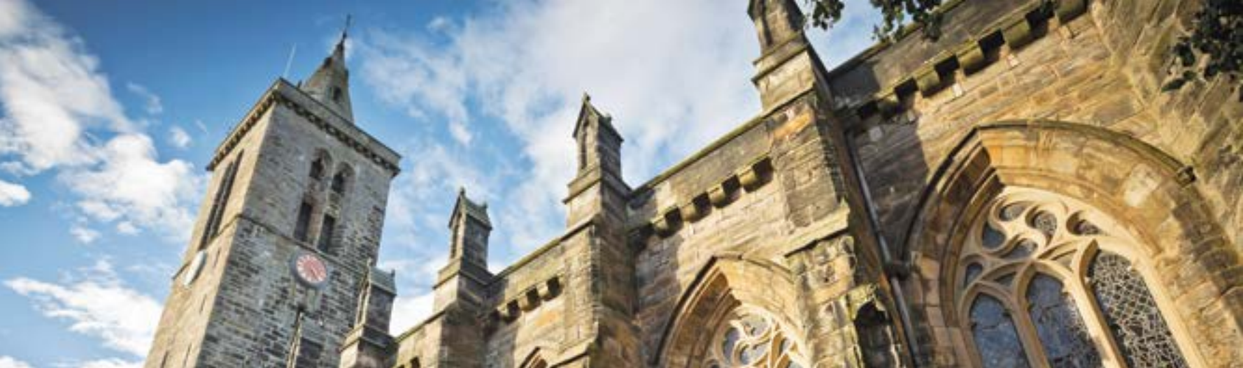
St Salvator's Chapel, University of St Andrews / St Salvator, Πανεπιστήμιο του St Andrews