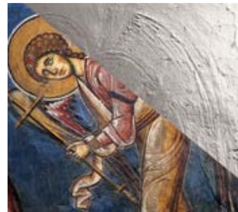
Angel, seen through reflectance transformation imaging (RTI) / Μορφή αγγέλου, με την τεχνολογία RTI

Byzantine painter Theodoros Apevdis is associated with a number of murals and icons in Cyprus, most notably at the hermitage of St Neophytos and the Church of the Virgin of Arakas. Building on the advanced technological infrastructure of DIOPTRA: The Edmée Leventis Digital Library of Cypriot Culture and the Imaging Cluster for Archaeology and Cultural Heritage (ICACH) of The Cyprus Institute, this collaborative project brings together The Cyprus Institute, the Department of Antiquities, the Church of Cyprus, the Centre for Research and Restoration of the Museums of France, the University of Illinois and the University of Southern California, and offers an interdisciplinary approach to Apevdis's work at the end of the 12th century. This important digital survey underlines the ways in which technology can enhance art historical research, offering additional insights to the evidence of historical sources and stylistic analysis. Through this project, imaging technologies and the use of analytical applications offer a quantitative level of inquiry thus revising our understanding of this important artist with broader implications for Cypriot history and the art of the Byzantine painter.