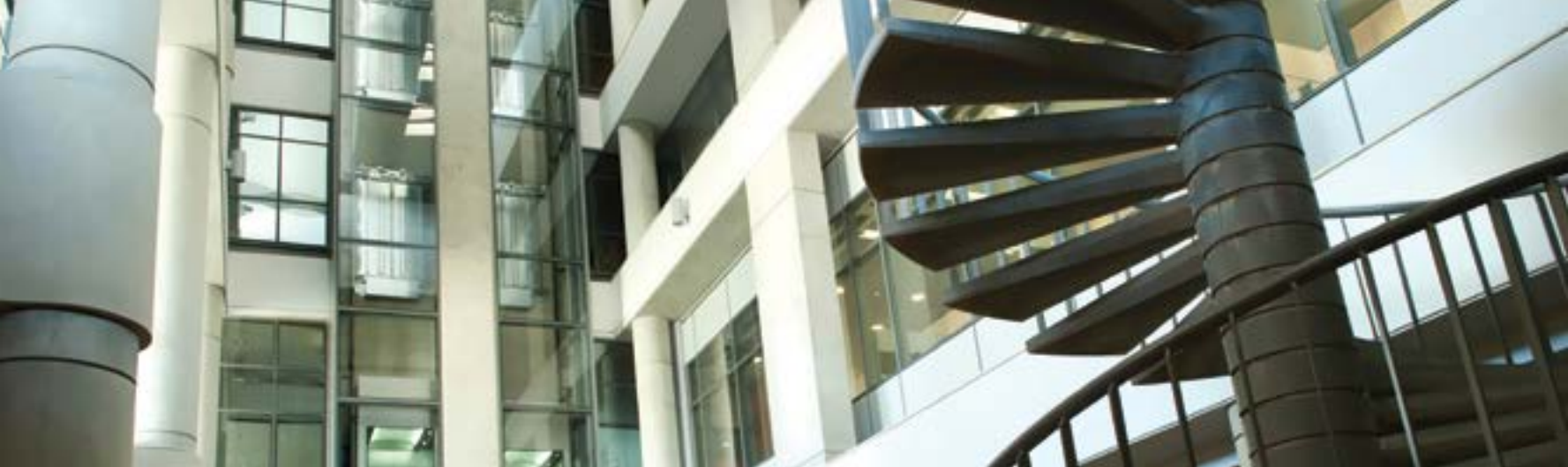
View of the Anastasios G. Leventis Senate building / Κτήριο Συμβουλίου-Συγκλήτου «Αναστάσιος Γ. Λεβέντης»