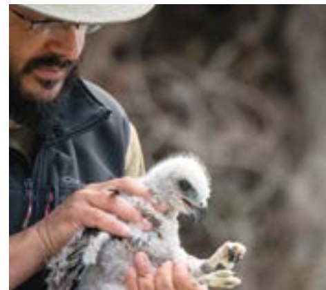
Bird ringing of common buzzard (Buteo buteo) nestlings / Δακτυλίωση νεοσσών γερακίνας (Buteo buteo)

The Antikythera Bird Observatory (ABO), the only bird observatory in Greece, is a long-running project of the Hellenic Ornithological Society (BirdLife Greece). The observatory operates on the island of Antikythera and the surrounding marine area and its key objective is the study of bird migration, focusing on the protection and conservation of migratory birds at a national and international level. The core activities of ABO are the study of bird migration through bird ringing, the monitoring of raptors' migration and the monitoring of the Eleonora's falcon colony in the area, which is one of the biggest in the world. All activities are carried out with the involvement of volunteers, making the project popular among young and future wildlife conservationists due to the capacity building provided. The project also supports the sustainable development of the island, promoting Antikythera as an ideal ecotouristic destination.