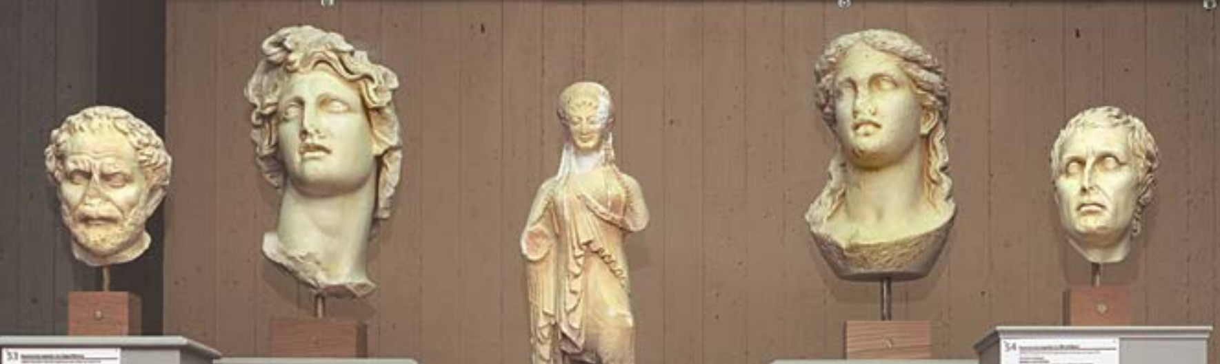
View of the hall of casts / Άποψη του χώρου των εκμαγιών