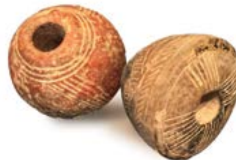
Cypriot ceramics from Bridges collection / Κυπριακή κεραμική από τη συλλογή Bridges

The project of digitisation of the Bridges collection of Cypriot archaeology was intended to make the material more accessible to academics and the public; to provide material for archaeology and museum studies students to experiment with creating virtual exhibitions; and to reconnect the material to its archaeological contexts by linking information, websites and topographic data. To create the contextual data, students have been involved in researching a range of pertinent excavation sites in Cyprus as well as in concentrating on issues concerning cultural property. Collaborating with colleagues in the university museum has helped address wider questions about the benefits –but also the limitations – of digital dissemination of archaeological collections. Experiments were run to assess perceptions of archaeological material through a range of different media, the results of which will be published in a research article on the role of 3D viewing in museums. Besides presentations in the context of teaching and digital humanities, the department will be presenting the project at museum conferences and training sessions for museum curators and teachers in 2017.