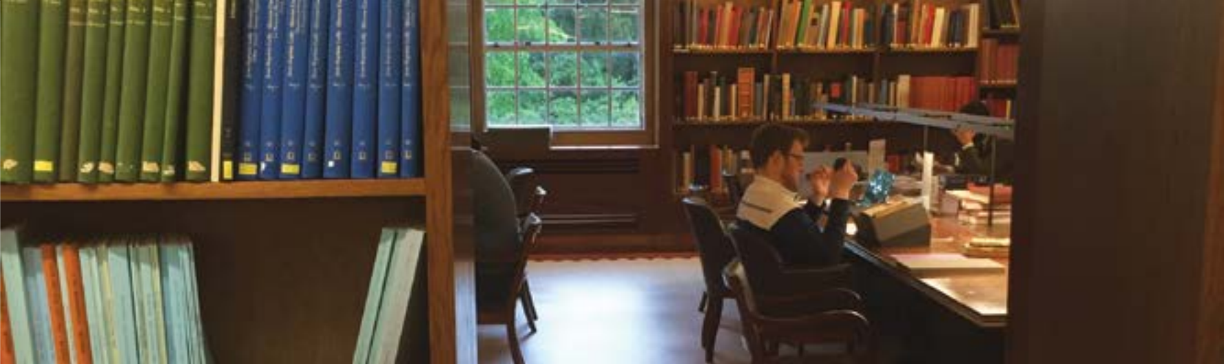
Library interior / Άποψη του εσωτερικού της βιβλιοθήκης