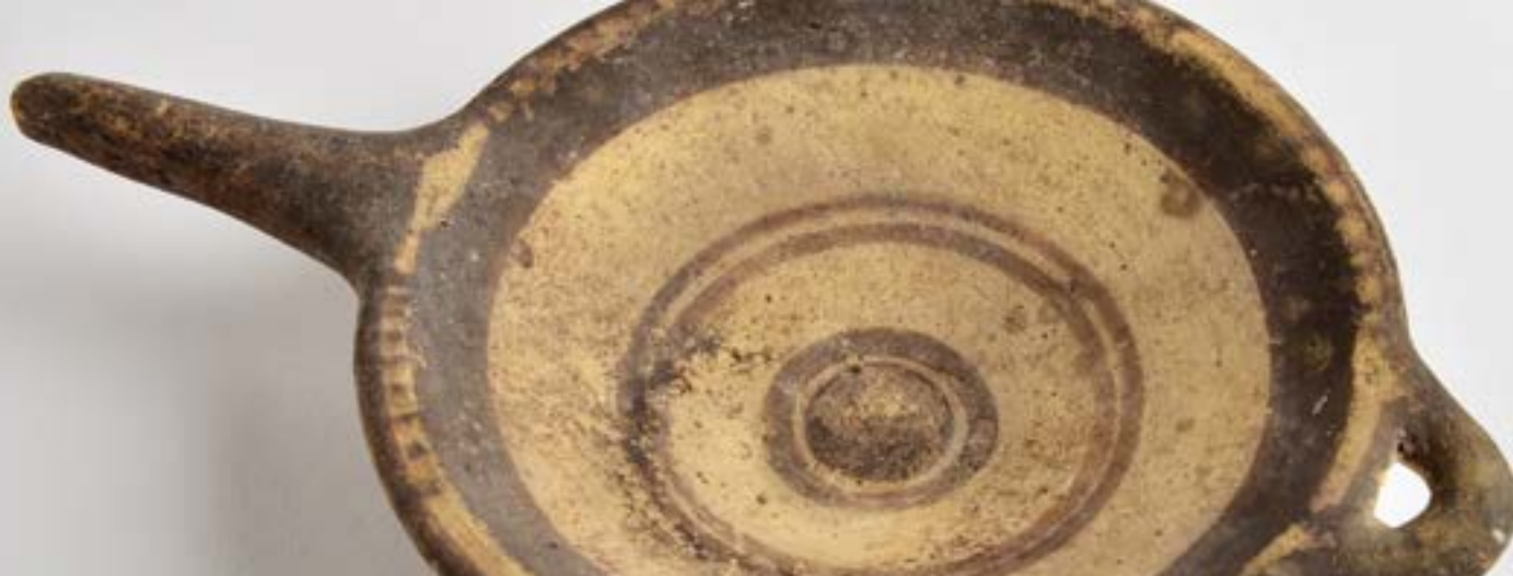
Dish of White Painted I ware, Cypro-Geometric I period (1050-950 BC) / Πινόκιο της Κύπρο-γεωμετρικής I περιόδου (1050-950 π.Χ.)