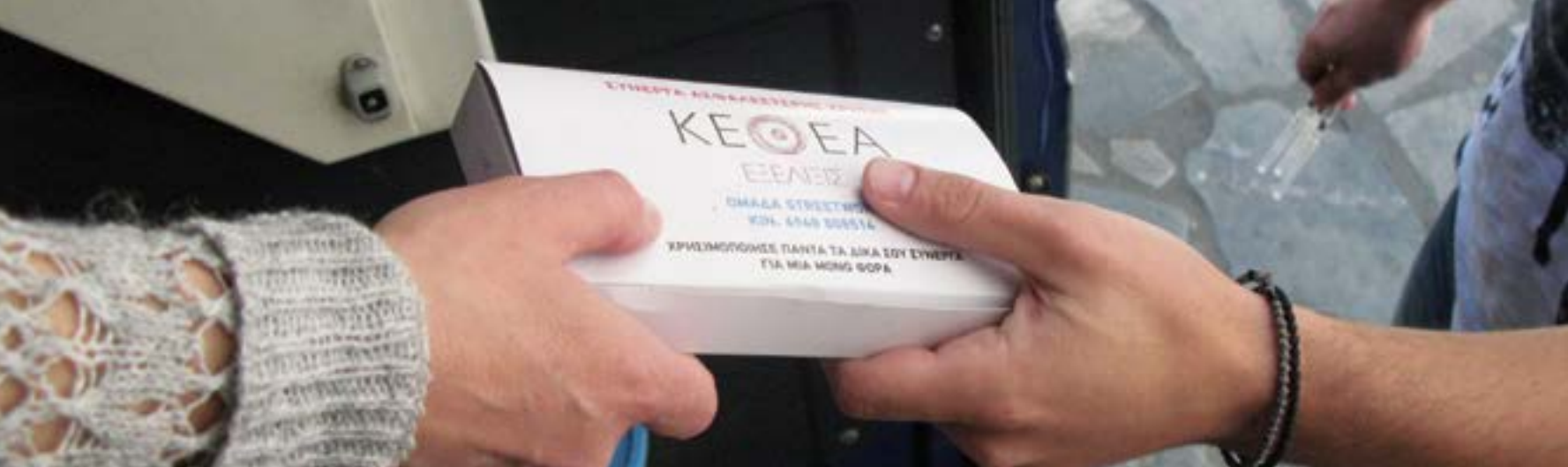
Handing over the exchange kit / Δίνοντας το κιτ ανταλλαγής