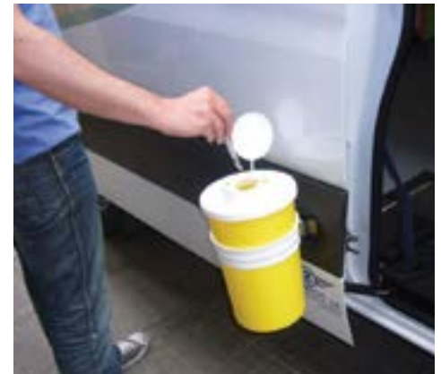
Mobile unit in action: exchange process / Διαδικασία ανταλλαγής με την κινητή μονάδα

KETHEA EXELIXIS, part of the KETHEA therapeutic programmes network, works to reduce the harm resulting from substance abuse, through a series of interventions and actions. Prompted by the increase in HIV infections among injecting drug users, KETHEA EXELIXIS initiated a syringe exchange street programme distributing sterile, disposable kits, to limit the re-use of injecting paraphernalia among drug users living in the streets and help safeguard public health. The syringe exchange project has had measurable success, with over 102.166 syringes exchanged in 2016. Key to the programme's success is the practice of exchange instead of syringe distribution, which both collects contaminated syringes, removing them from the streets and ensuring their safe disposal, and facilitates attempts by the street-working team to liaise with drug users and offer support and incentives to fight addiction.