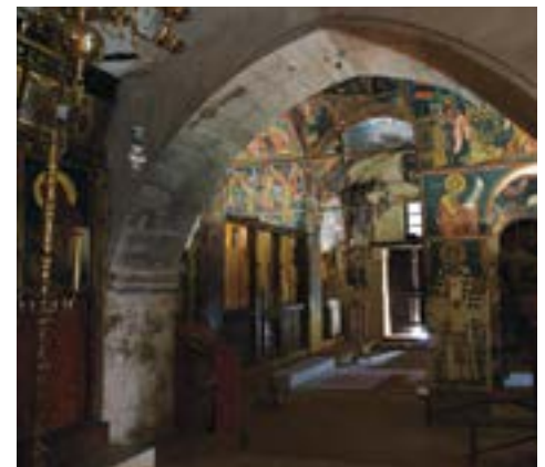
Agios Ioannis Lampadistis, interior view / Άγιος Ιωάννης Λαμπαδιστής, εσωτερικό

The natural lighting of the Byzantine and medieval churches of Cyprus that remain in liturgical use throughout the centuries has often changed dramatically, as a consequence of interventions to the buildings that aim to meet the growing needs of church-goers and visitors – including structural interventions that affect both the quantity and quality of sunlight entering churches and disrupt the once harmonious relationship between the exterior and the interior. Moreover, the artificial lighting systems installed to meet liturgical needs or to accommodate visitors are often installed without previous planning or study, altogether lacking in direction and principles. In response to this need and in collaboration with the Department of Antiquities in Cyprus, the A. G. Leventis Foundation has supported the installation of artificial lighting systems in ten churches in the Mt Troodos region which are on the UNESCO List of World Heritage Sites, in a way that highlights their unique historical importance and spiritual character.