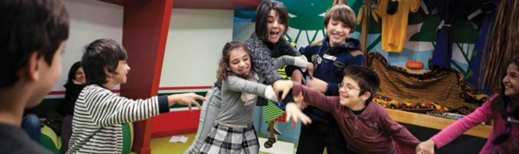
Educational programmes for children / Εκπαιδευτικά προγράμματα για παιδιά