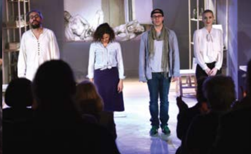
A. G. Leventis Gallery: key moments of 2016 / Στιγμιότυπα από τις δράσεις της Λεβεντείου Πινακοθήκης το 2016