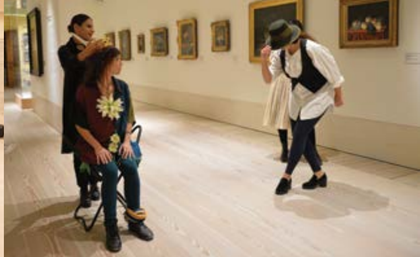
A. G. Leventis Gallery: key moments of 2016 / Στιγμιότυπα από τις δράσεις της Λεβεντείου Πινακοθήκης το 2016