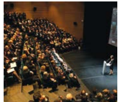
View of the auditorium / Άποψη του αμφιθεάτρου

The Michael Cacoyannis Foundation was established in 2003 by the Cypriot filmmaker Michael Cacoyannis as a modern cultural institution with a particular focus on the support of the performing arts – mainly theatre and cinema – and on the promotion of art education in Greece. Envisaged as a state-of-the-art space that would embrace modern technology and foster innovative new ideas, the MCF has worked significantly over the years to build a network of international collaborations and offer a voice to promising young artists, by nurturing budding talent. In 2016-2017, the MCF planned and carried out a rich agenda of cultural events and initiatives, from theatrical and musical productions to educational programmes for children of all ages, promoting collaborations and developing existing partnerships with organisations and institutions both in Greece and overseas. The MCF also focused on outreach activities to engage a broader public, while maintaining consistently a low pricing policy in its leading cultural events in order to promote broad participation and ensure inclusivity, enhancing cultural life in Athens, with the support also of organisations such as the A. G. Leventis Foundation.