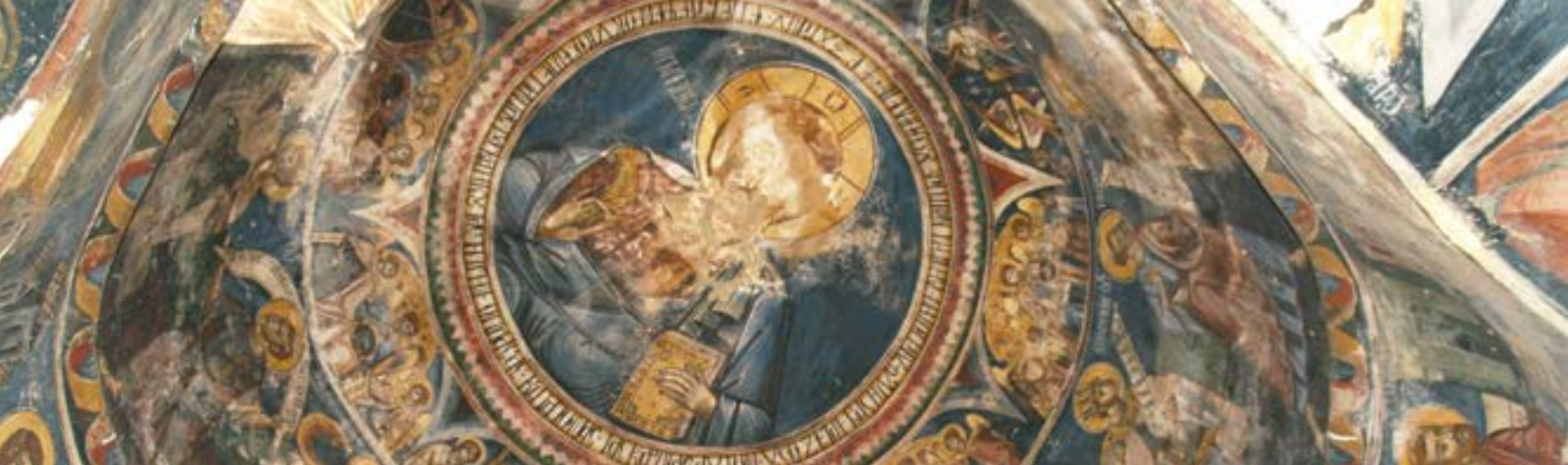
Wall paintings of the dome before conservation / Τοιχογραφίες στον τρούλο πριν τη συντήρηση