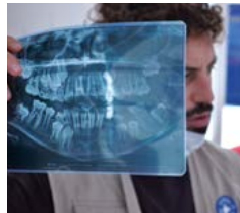
MdM Athens open polyclinic, dental department / Στο οδοντιατρείο των MdM

MdM Greece operate open polyclinics in Athens, Perama, Thessaloniki, Chania, Patras and Kavala, to support vulnerable people and social groups with limited or no access to the National Health System, such as uninsured and homeless people as well as migrants and refugees. Run by MdM volunteer medical and nursing staff, the open polyclinics focus on the provision of primary healthcare services, pharmaceutical coverage and psychosocial counselling. With the support of organisations such as the A. G. Leventis Foundation, from January to October 2016, the MdM Athens open polyclinic offered medical services to over 32.400 beneficiaries, distributed 635 courses of prescribed medication, and gave paediatric treatment and vaccination to 4.020 children. In total the open polyclinics reached 75.866 beneficiaries in 2016, caring for those most in need across the country.