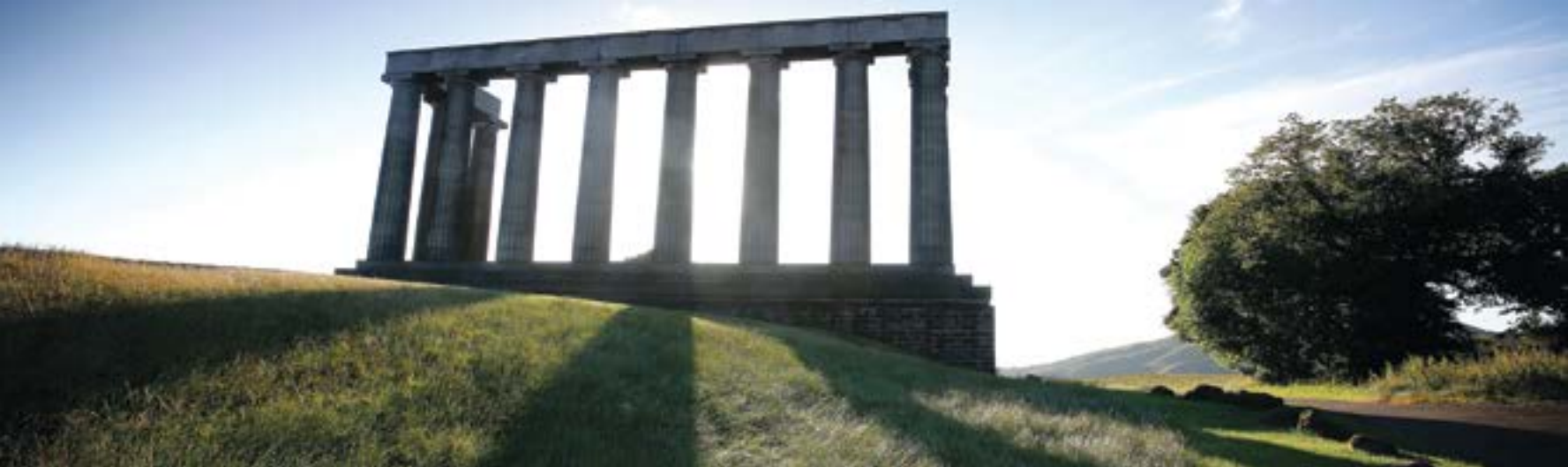
Scottish National Monument, Calton Hill / Εθνικό Μνημείο της Σκωτίας, Calton Hill