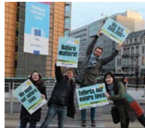
Campaigning for nature at the European Commission / Εκστρατεία για τη φύση στην Ευρωπαϊκή Επιτροπή

In recognition that the EU Nature Directives are the bedrock of nature conservation across Europe, organisations working to protect biodiversity and the environment in Europe campaigned – following the 2014 mandate of the EU Environment Commissioner to ‘modernise’ nature directives – to ensure there would be no weakening of the laws needed to protect the environment, which would be disastrous for people, wildlife and the economy. The A. G. Leventis Foundation provided support to enable BirdLife organisations across the EU to maintain pressure on the European Commission for an additional 18 months until a decision was finally published. Through media, events and demonstrations the campaign reminded the Commission of the public mood – which was overwhelmingly in favour of nature protection: the largest ever public response to an EU consultation. In December 2016 the campaigning for nature was rewarded with a decision to retain the laws in their current form, and the Commission will bring forward measures to support better implementation and funding of the Nature Directives, to better protect and restore nature across Europe.