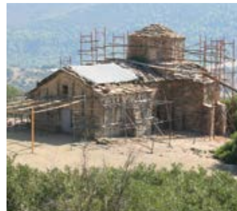
General view of Agios Dimitrios Bada / Γενική άποψη του Αγίου Δημητρίου Μπάδα

The church of Agios Dimitrios Bada in Petrochori is one of the most important Byzantine monuments of Achaia. Built at the foot of Mt Erymanthos, with a view to the gulf of Patras, it was formerly the katholikon of a monastery and currently a dependency under the parish of Maritsa monastery. A free cross-plan domed building with a later-date narthex, it dates from the end of the 12th century. A fine structure, it is characterised by the abundant use of decorative brickwork, typical of the masonry of the church's first phase of construction, while the interior is decorated with wall paintings executed in the 18th century by the Nezeriti painter Andreas, in the so-called anti-classical style of post-Byzantine painting. Severely damaged by an earthquake in 2008, the structure could no longer be used for services. To restore the monument, the A. G. Leventis Foundation and the Ch. K. Leventis Foundation jointly support a two-year project, conducted under the supervision of the Ephorate of Antiquities of Achaia, which includes structural support, mural conservation, as well as landscaping of the surrounding area.