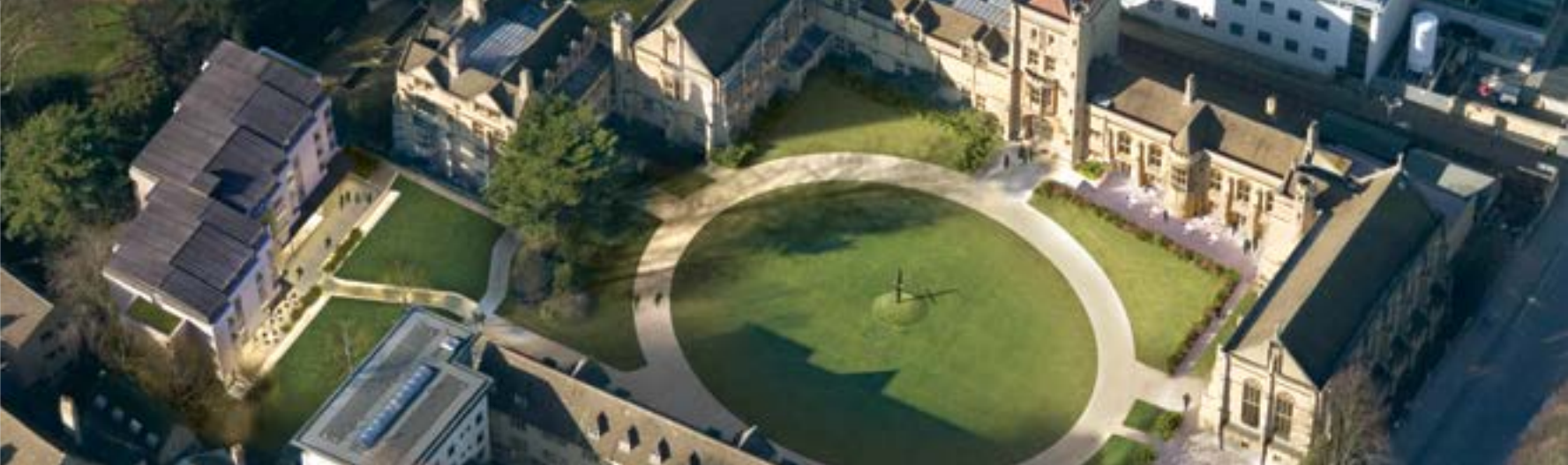
Aerial photograph of the College / Αεροφωτογραφία του Κολεγίου