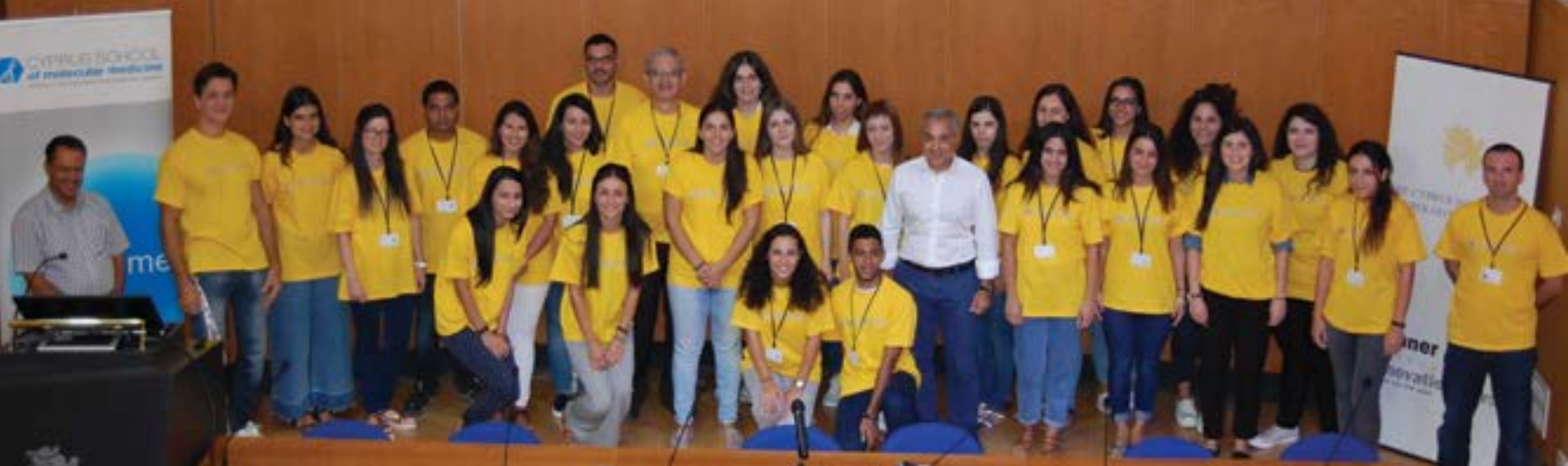
Students of the Cyprus Institute of Neurology and Genetics, Nicosia / Φοιτητές στο Ινστιτούτο Νευρολογίας και Γενετικής Κύπρου