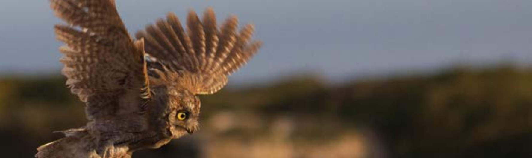
Scops owl (Otus scops) / Γκιώνης (Otus scops)