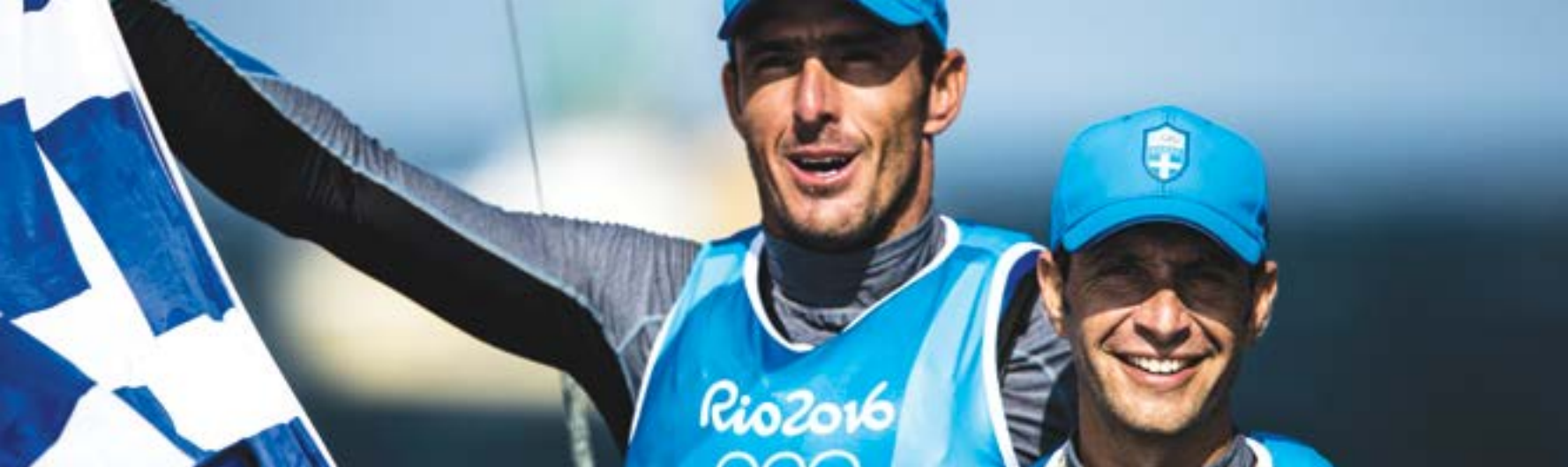
Panagiotis Mantis and Pavlos Kagialis, bronze medallists in the men's 470 sailing class at the Rio 2016 Olympic Games / Οι Παναγιώτης Μάντης και Παύλος Καγιαλίδης, χάλκινοι ολυμπιονίκες στο Ρίο, στην ιστιοπολία (κατηγορία 470)