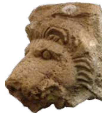
Lion's head waterspout, 1st century BC / Κρήνη με τη μορφή λεοντοκεφαλής, 1ος αιώνας π.Χ.

Pinakes , stone trays, amulets and a scarab are among objects reflecting to cult ritual. An ostrakon reading “Apollo” points to the divinity worshipped on “Holy Island”.