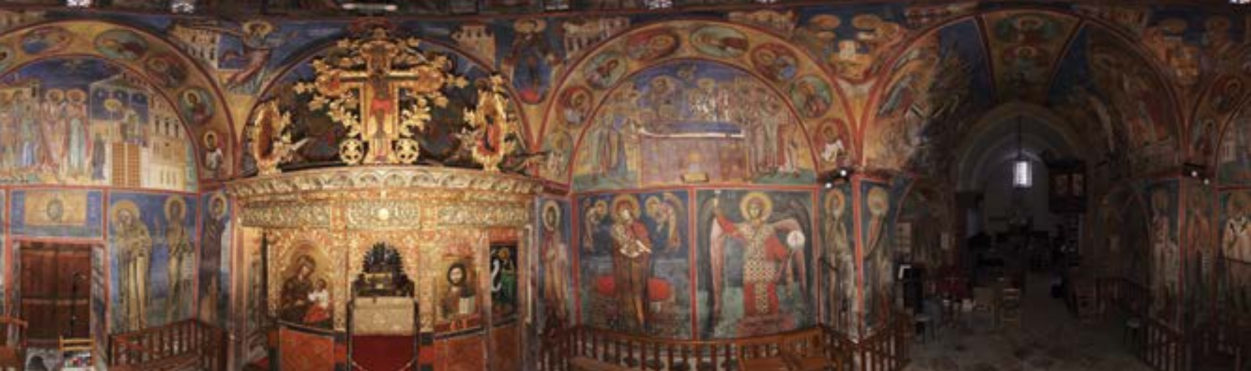
Church of the Virgin of Arakas, Lagoudera, panoramic view of the interior / Παναγία του Άρακος, Λαγουδερά, πανοραμική άποψη του εσωτερικού