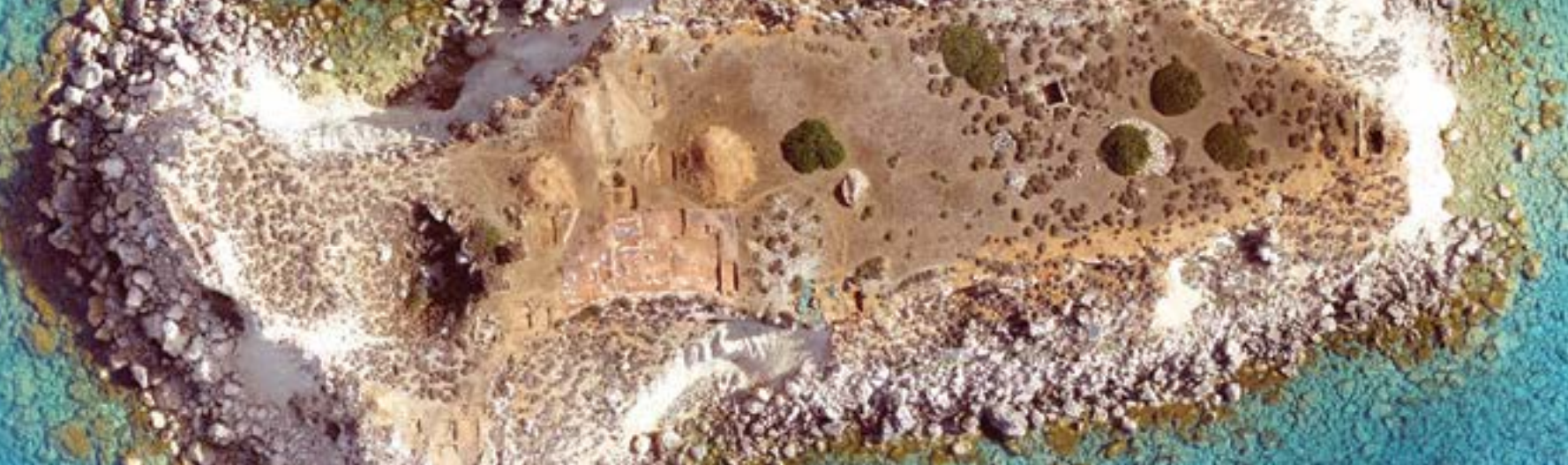
Yeronisos island, aerial photograph / Γερώνισος, αεροφωτογραφία