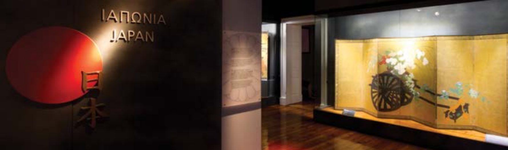
Corfu Asian Art Museum, Gallery of Japanese Art / Μουσείο Ασιατικής Τέχνης Κέρκυρας, Αίθουσα Ιαπωνικής Τέχνης