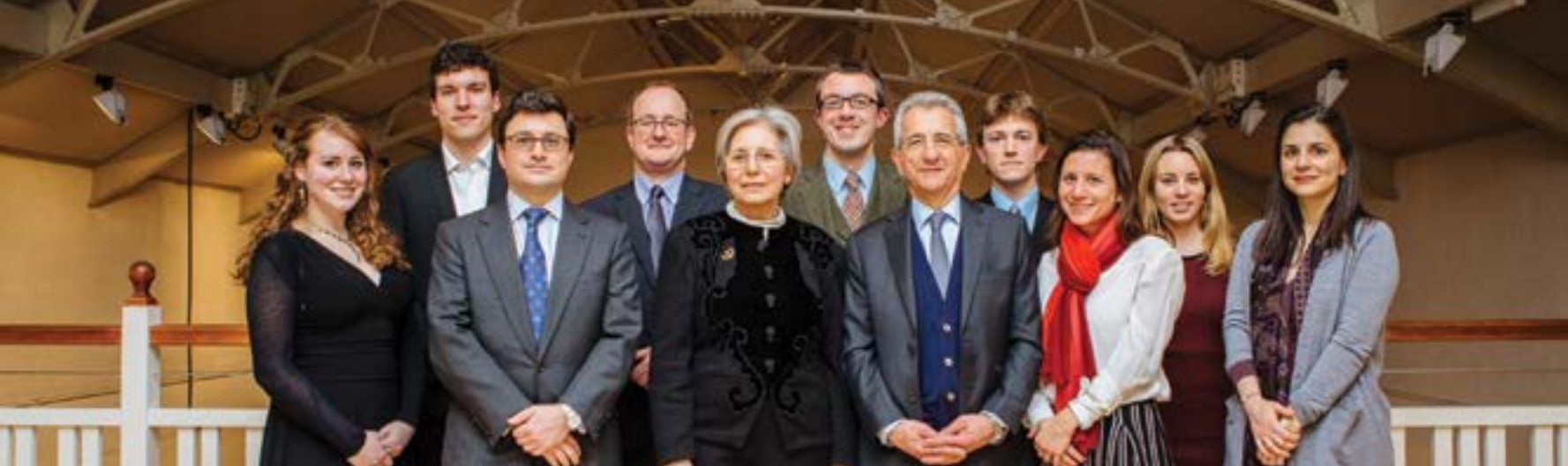
University of Exeter Stewardship event at the Hellenic Centre, London / Από την εκδήλωση του Πανεπιστημίου του Exeter στο Ελληνικό Κέντρο του Λονδίνου