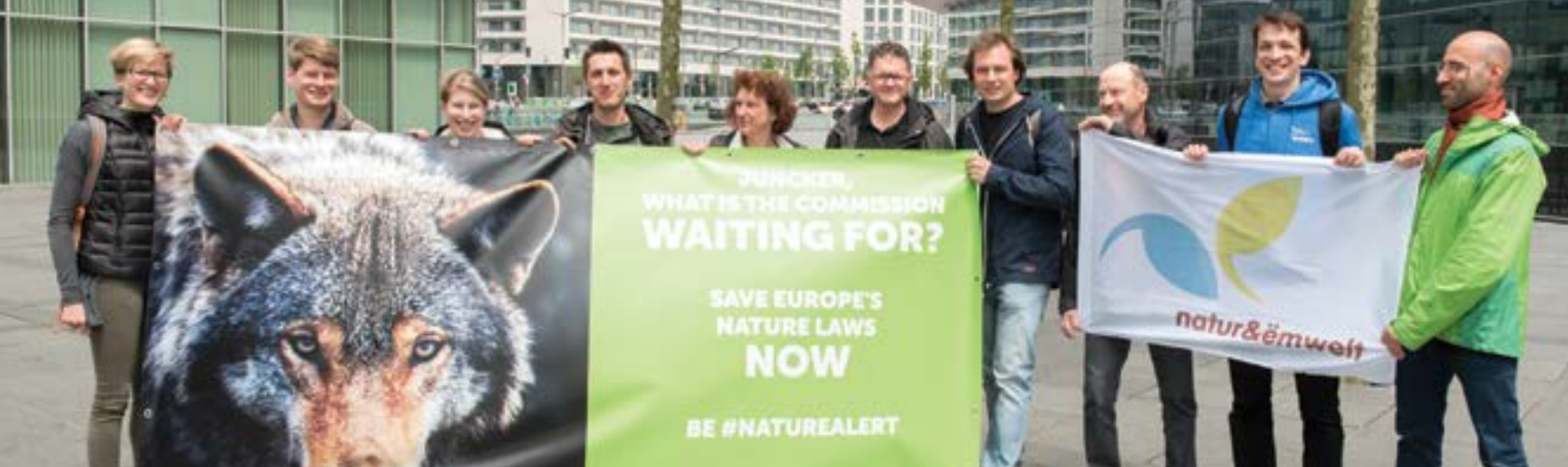
Defending the EU Nature Directives / Υπεράσπιση του ευρωπαϊκού νομοθετικού πλαισίου για τη φύση, RSPB και BirdLife Europe