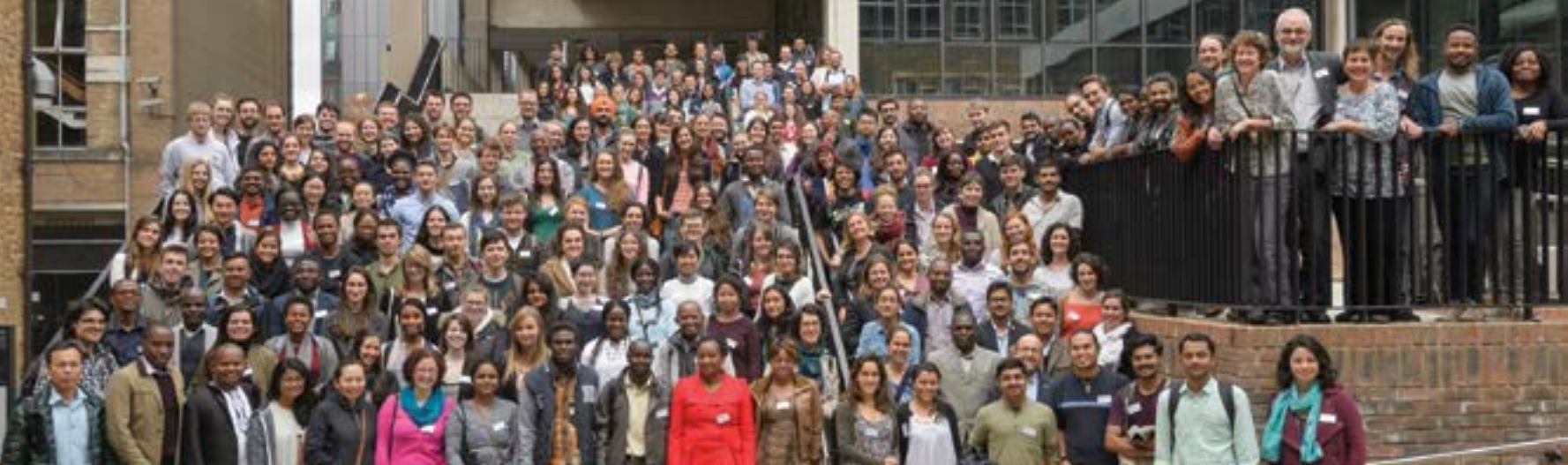
Conference participants, group photo / Οι σύνεδροι, ομαδική φωτογραφία