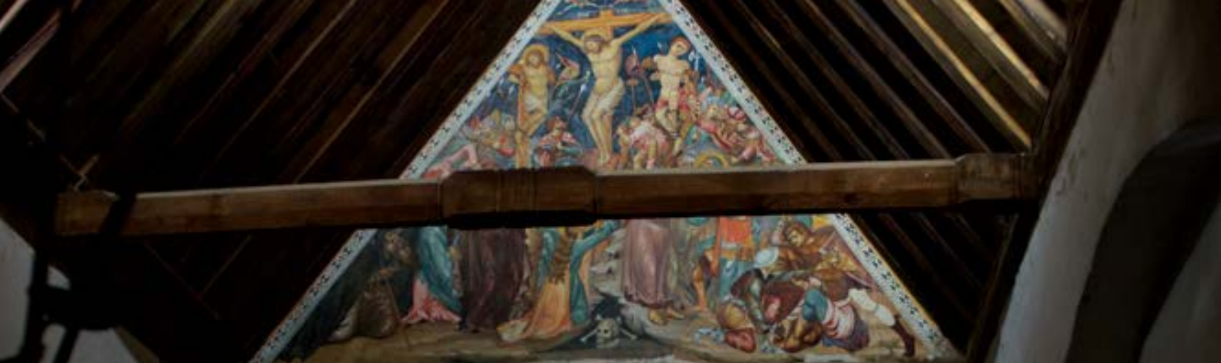
Lighting in Panagia Podithou, Cyprus / Φωτισμός στην Παναγία της Ποδίθου, Κύπρος