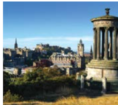
Dugald Stewart Monument / Το μνημείο Dugald Stewart