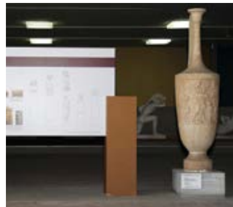
View of the hall, with the new information panels / Άποψη του χώρου με το νέο πληροφοριακό υλικό