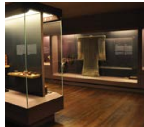
2nd floor gallery “Life in Edo” / Αίθουσα 2ου ορόφου «Η ζωή στο Έντο»