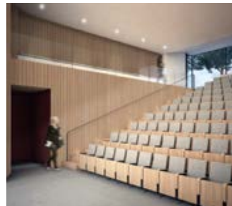
CGI lecture auditorium / Το αμφιθέατρο του CGI

The Bonavero Institute of Human Rights (BIHR), inspired by the vision of the Principal of Mansfield College, Baroness Helena Kennedy QC, and created with the support of the A. G. Leventis Foundation, is a research institute of the Faculty of Law, University of Oxford. Inaugural Director Justice Catherine O'Regan was appointed in October 2016, and starting October 2017 the Institute will be housed at Mansfield College, with the aim of fostering excellent research and scholarship in human rights law and improving the understanding of human rights law beyond the academy. In this light, the Institute aims to integrate existing human rights research and practice within the Faculty of Law, to host a cohort of outstanding visiting scholars and practitioners, and to collaborate with human rights scholars in other disciplines and with legal practitioners engaged in human rights work across the world.