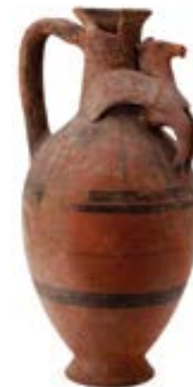
Jug of Bichrome Red II ware, Cypro-Archaic II period (c. 600-480 BC) / Σκεύος της Κύπρο-αρχαϊκής II περιόδου (π. 600-480 π.Χ.)

In 2015 the Cyprus Institute, based in Nicosia, initiated a research programme for the digital cataloguing of Cypriot antiquities in museums around the world. Unlike the large collections of Cypriot antiquities in leading museums of Europe and the USA – which are well-known and mostly well-documented in illustrated catalogues – other, smaller collections in museums, universities and other institutions are less accessible or even mostly unknown even among specialists. This digital registry is intended to facilitate research by scholars working in the field of Cypriot art and archaeology by providing broader access to the wealth of available material. To enable smaller museums to participate in the project, A. G. Leventis Foundation is supporting the digitisation of their collections, with those of the Hastings Museum and Art Gallery and the Mercer Art Gallery, Harrogate completed to date, and several others soon to be undertaken.